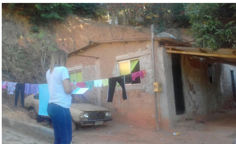
Figura 1. Registro fotográfico da visita.

No dia 08/06/2017, equipe técnica da empresa Synergia, enviou SMS para os números declarados pelo manifestante, com o objetivo que a família entre em contato com a empresa para realização do Cadastro Integrado.